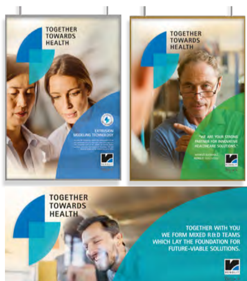
POSTER / ADVERTENTIE